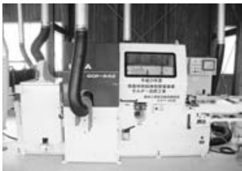
▲モルダー（四面鉋盤）導入事業