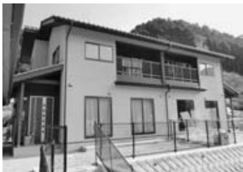
▲村営住宅建設事業