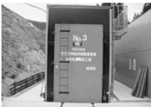
▲木材乾燥機導入事業