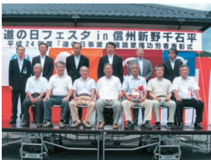
◀横旗地区の皆さん

ホームページアドレス http://www.nebamura.jp メールアドレス info@nebamura.jp 印刷 龍共印刷株式会社