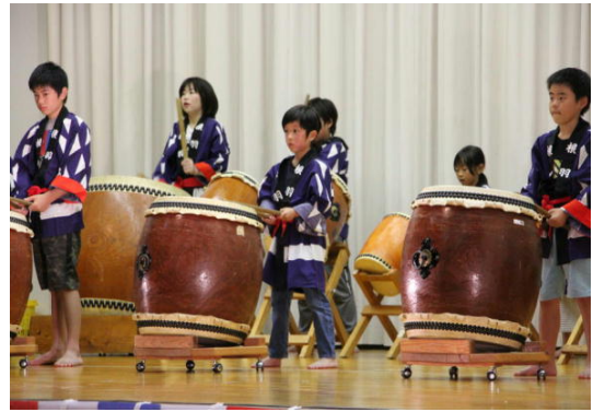
ふるさと太鼓（前期課程）