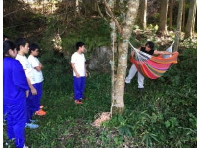
NICE ツアー～みんなで作ろう森の楽園～ (SDGs 優秀賞受賞 令和元年度 中2)