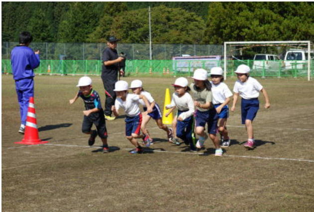
全校マラソン大会