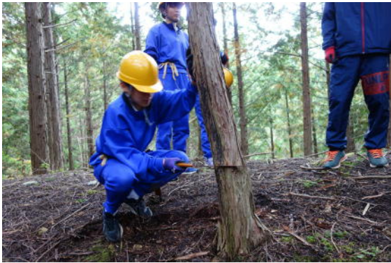
林業体験（後期課程）