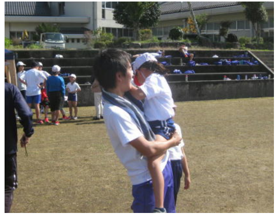
1年生と9年生のふれあい