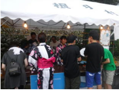
村の盆踊り大会の企画・出店 (令和元年度 中3)

9年間の見通しを持ったカリキュラムを実施し、主体的・探究的な学びとなるように、「総合的な学習の時間」等を通して学習を深めます。