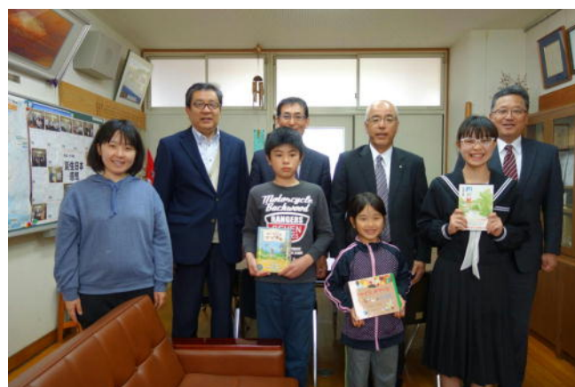
誕生日には村から本のプレゼント