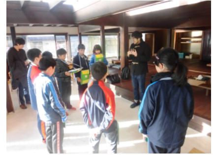
キレネバ（根羽をきれいに）の取組 (令和元年度 小6)