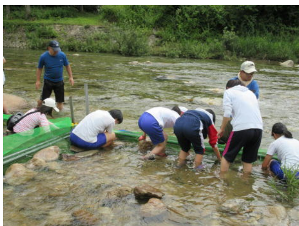
PTA主催の魚つり魚つかみ大会